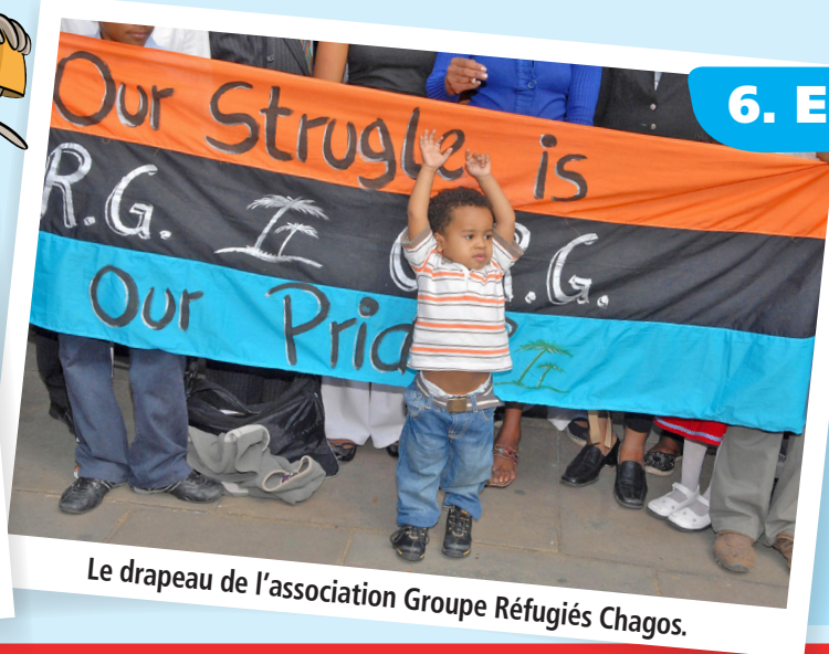
Le drapeau de l'association Groupe Réfugiés Chagos.