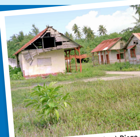
Maisons abandonnées à Diego Garcia.

Une fois l'archipel pris, les Britanniques ont fait partir tous les habitants. Hommes, femmes et enfants ont été emmenés de force à l'île Maurice et aux Seychelles, en bateau. Depuis, les Chagossiens réclament le droit de retourner dans leurs îles. Mais les Anglais s'y opposent fermement.