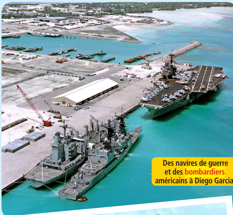
Des navires de guerre et des bombardiers américains à Diego Garcia.