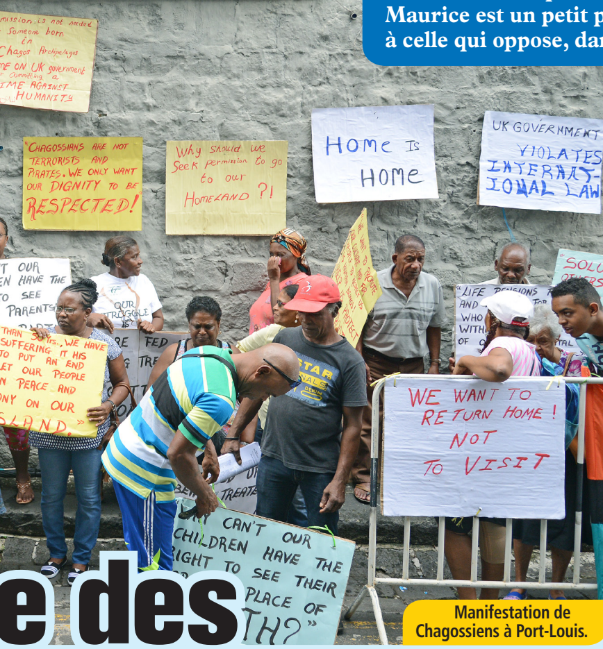
Manifestation de Chagossiens à Port-Louis.

Maurice réclame la restitution des Chagos depuis 50 ans, sans y parvenir. Cette lutte ne se fait pas à armes égales. D'un côté, le Royaume-Uni et les États-Unis font partie des pays les plus puissants du monde. De l'autre, Maurice est un petit pays qui a très peu d' influence . Cette bataille ressemble à celle qui oppose, dans la célèbre fable, le pot de terre au pot de fer.