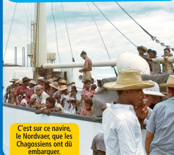
C'est sur ce navire, le Nordvaer, que les Chagossiens ont dû embarquer.

La question des Chagos fait régulièrement la Une de l'actualité. Maurice et le Royaume-Uni se disputent cet archipel depuis un demi-siècle. Que s'est-il passé ?