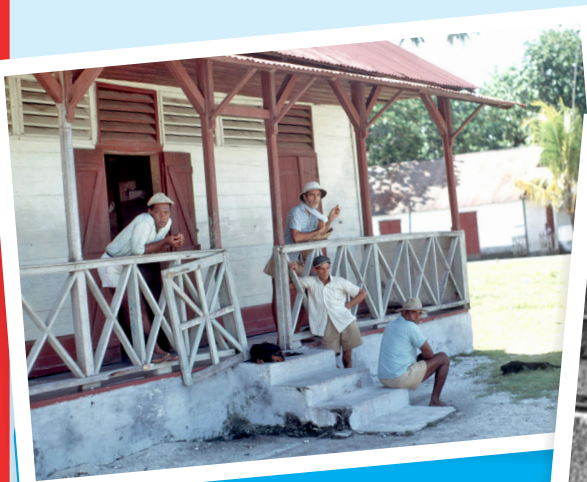
Aux Chagos dans les années 1960.