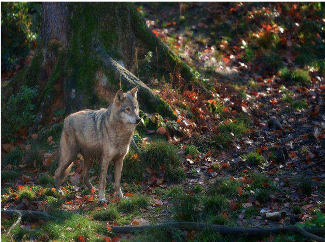
Le loup des Carpates