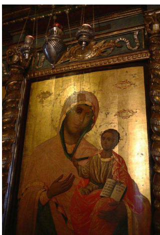
Une icône dans l'église Ilie Gorgani à Bucarest

Ces images sont considérées comme sacrées. Elles représentent la Trinité, la Vierge Marie, le Christ, les saints... Fixes ou mobiles, on les installe dans les maisons et dans les églises où elles couvrent des parois (on parle alors d'iconostases).