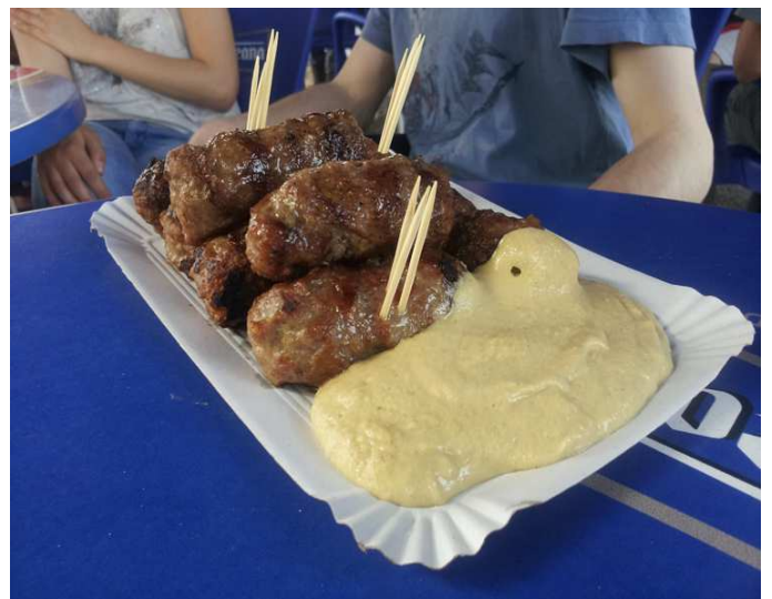
Des micis et leur moutarde

des roumains les fast-food (Mac Do, KFC etc). les jeunes qui aiment Richard et Marseilon