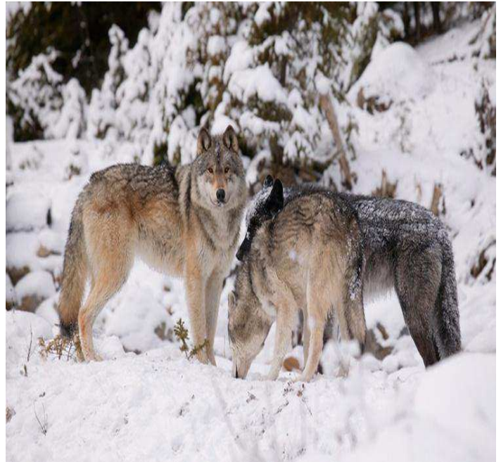
Une meute de loups dans la neige