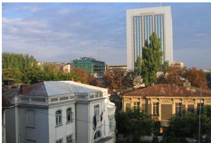
Une vue de la ville de Bucarest