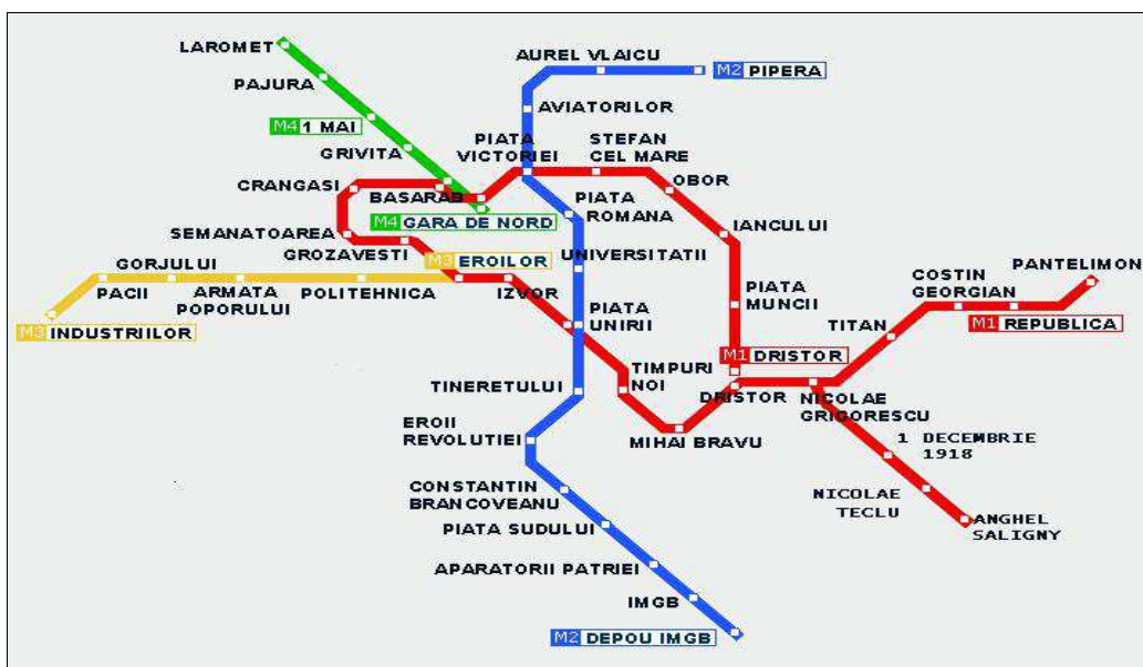
Plan du métro de Bucarest