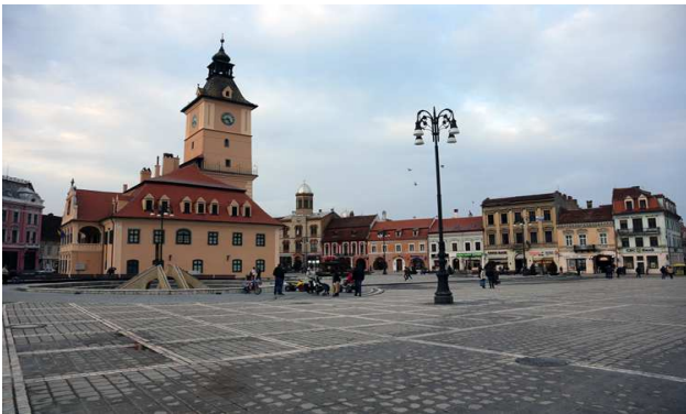
2. La place principale de Brasov