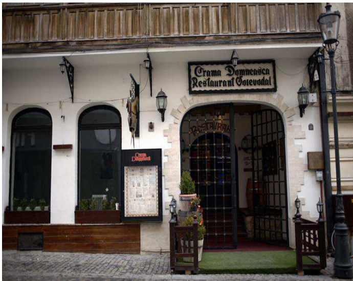
Le restaurant Crama Domneasca à Bucarest.