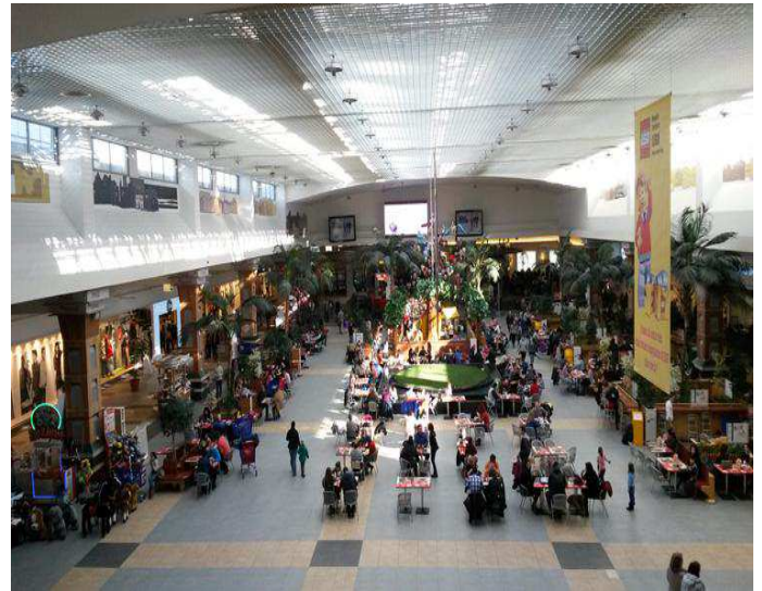
Un hall du Polus Center à Cluj