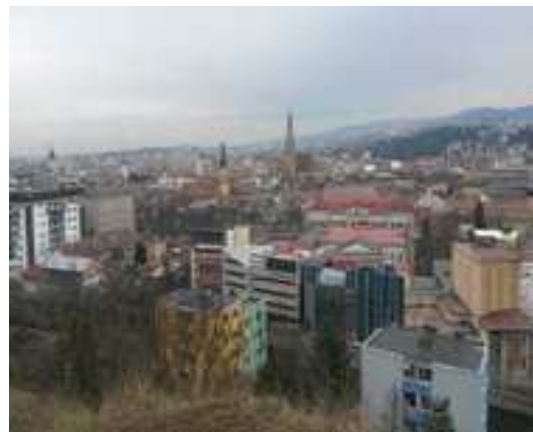
4. Vue sur la ville de Cluj