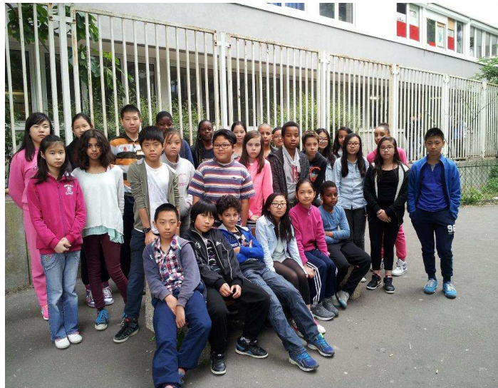
La classe de 6èmeD

un pays avec lequel nous avons des liens. Les roumains parlent français, Bucarest s'appelait le « petit Paris ». D'ailleurs il y a un Arc de Triomphe aussi dans la capitale roumaine. C'est un pays différent mais égal. Nous avons appris à connaître une autre culture, un autre mode de vie, une autre cuisine.