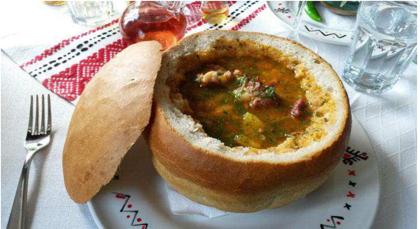
Soupe servie dans un pain creusé