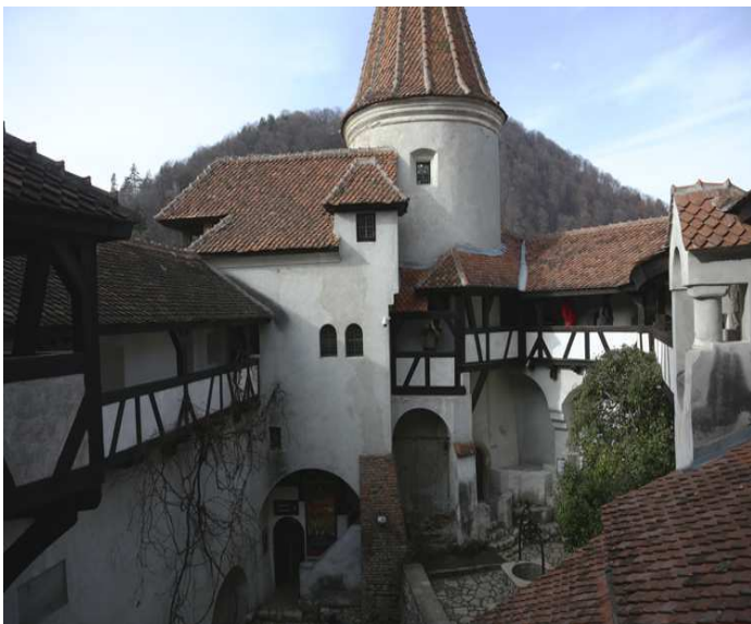
Une vue d'ensemble du château

Les stands de souvenirs dans l'allée qui mène au château