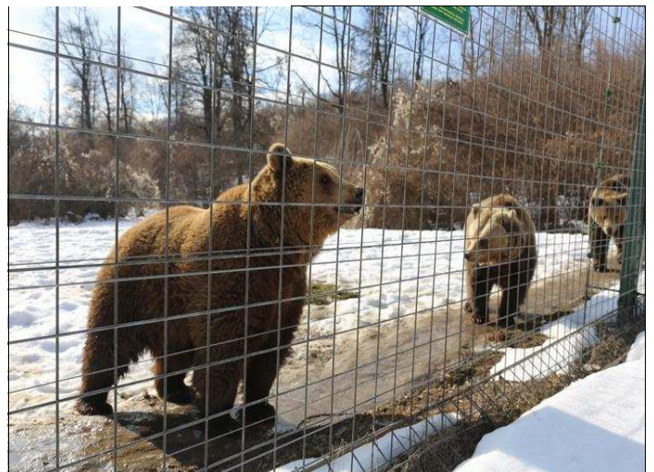
Les ours de la réserve de Zarnesti