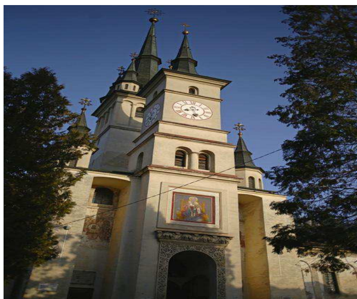
Église orthodoxe, Brasov

Les églises ont un style basilical et c'est aussi le style d'une croix avec coupole, avec des crochets, il y a pas de statues mais ils ont des icônes. Il y a des vitraux qu'on trouve aussi dans les églises catholiques.