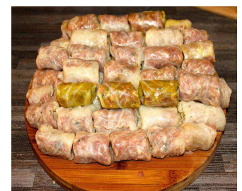
Un plateau de sarmale