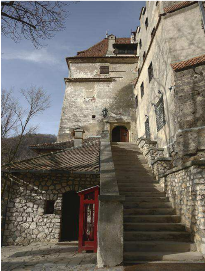
L'entrée du château de Bran