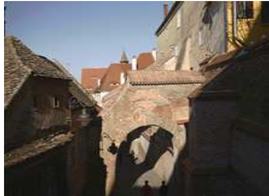
5. Sibiu est une citadelle