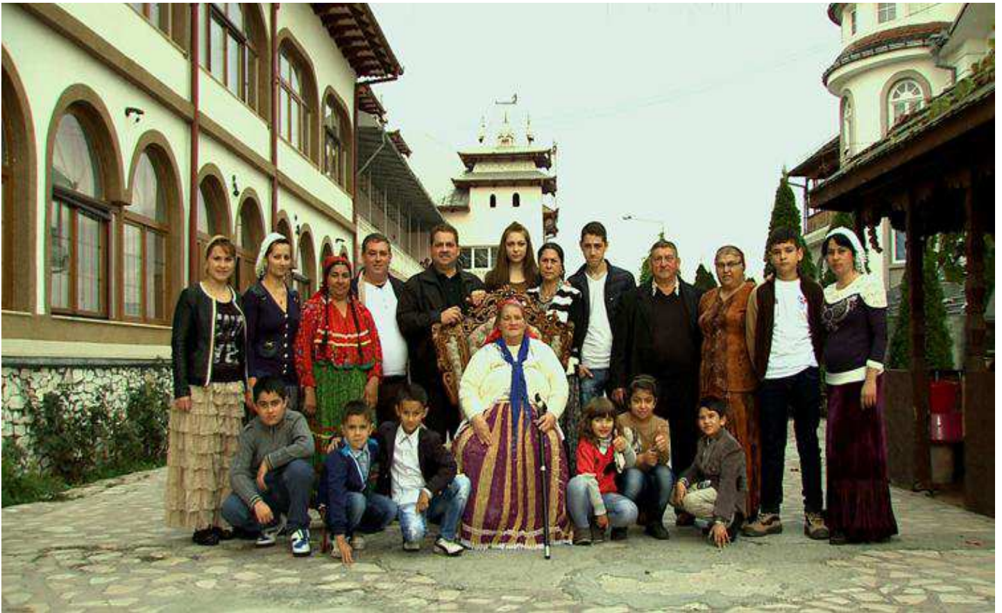
Famille rom à Tirgu Jiu, dans le centre de la Roumanie