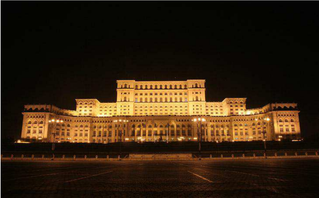
Le grand Palais à Bucarest