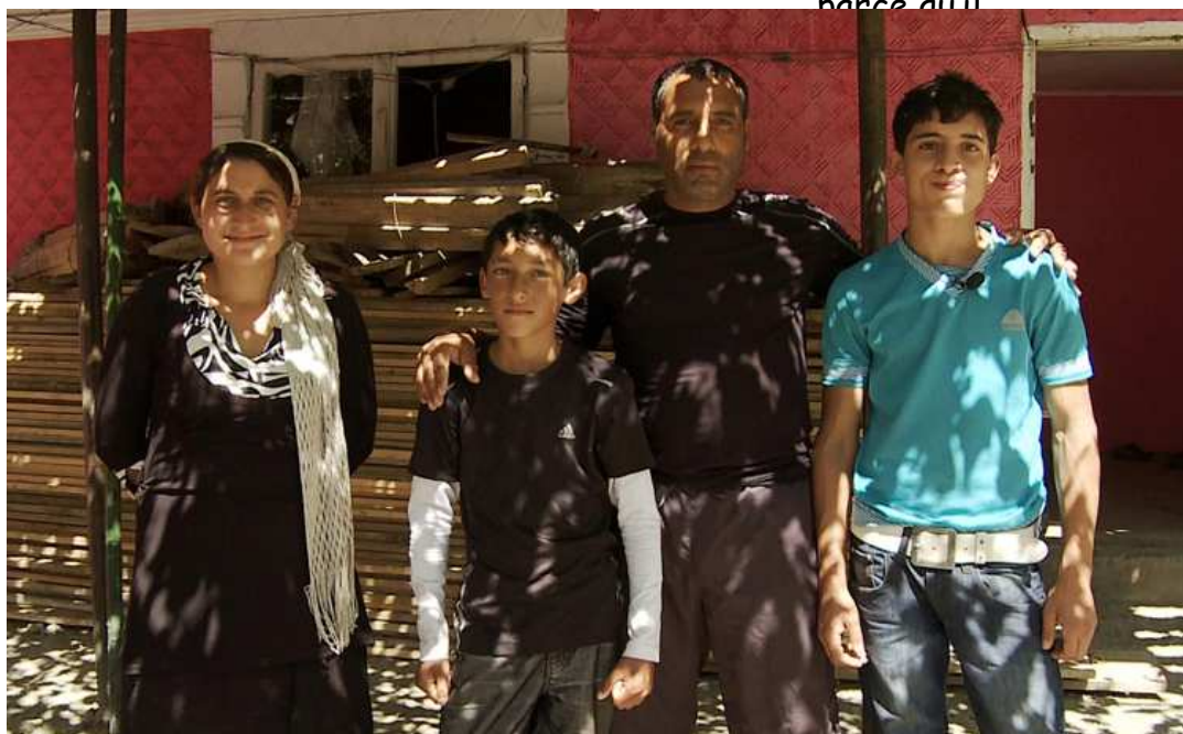
La famille Duduveica