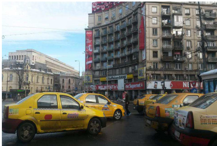
Taxis jaunes à Bucarest, comme à New-York!

Les autres moyens de transport sont : le métro, le tram, le bus. Le métro de Bucarest est plus propre qu'en France et les stations sont beaucoup plus jolies. Les stations de métro sont en marbre pas très originales cependant. Le transport n'est pas très cher. Un pass mensuel pour le bus et le tram coûte 50 ronds, cela équivaut à 12€ en