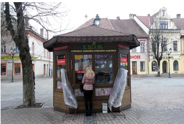
3. Un kiosque à Bistrita