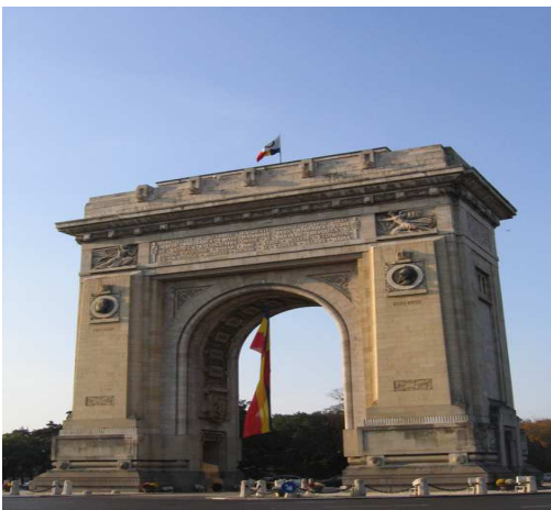
1. L'arc de triomphe de Bucarest