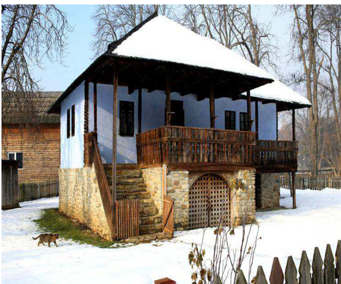
Une maison traditionnelle roumaine