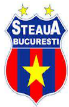
Les couleurs du Steaua Bucuresti