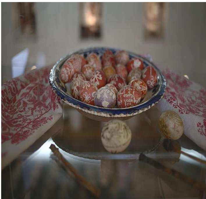
Des œufs peints au musée ethnographique de Cluj