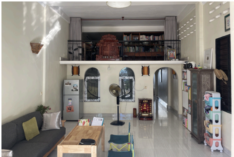
Le salon et la mezzanine de l'appartement de la famille de Channa