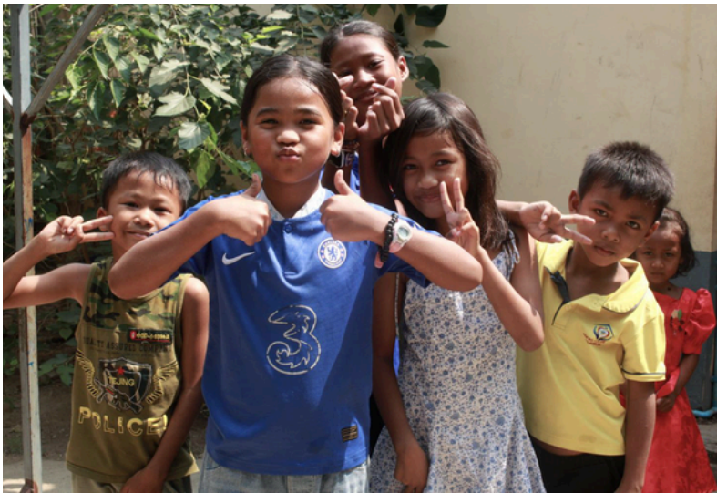
Les enfants du Refuge Kol

Initialement prévu pour accueillir des enfants ayant subi une chirurgie cardiaque, le Refuge Kol héberge actuellement 52 enfants de 6 à 17 ans issus de familles en grande difficulté.