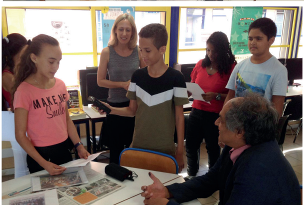
L'interview a été réalisée pour la radio du collège, CJL Magazine.