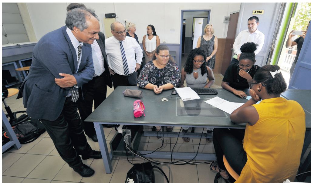
Du préscolaire à l'université, le recteur fait appliquer la politique qui a été décidée en Conseil des ministres.