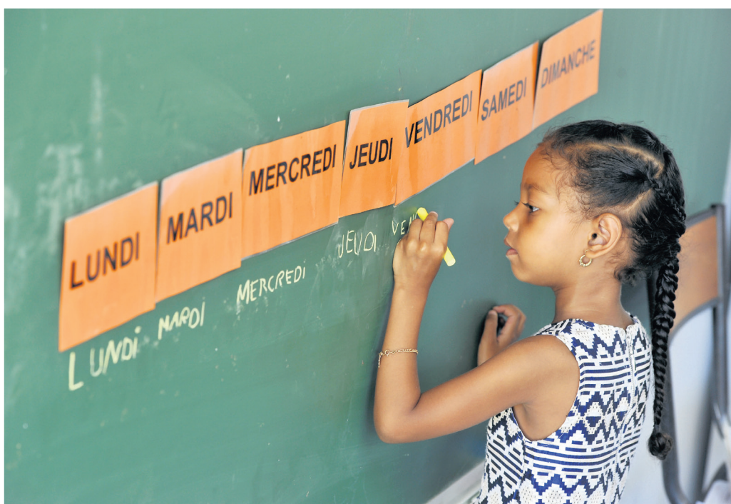
« L'école est une chance »